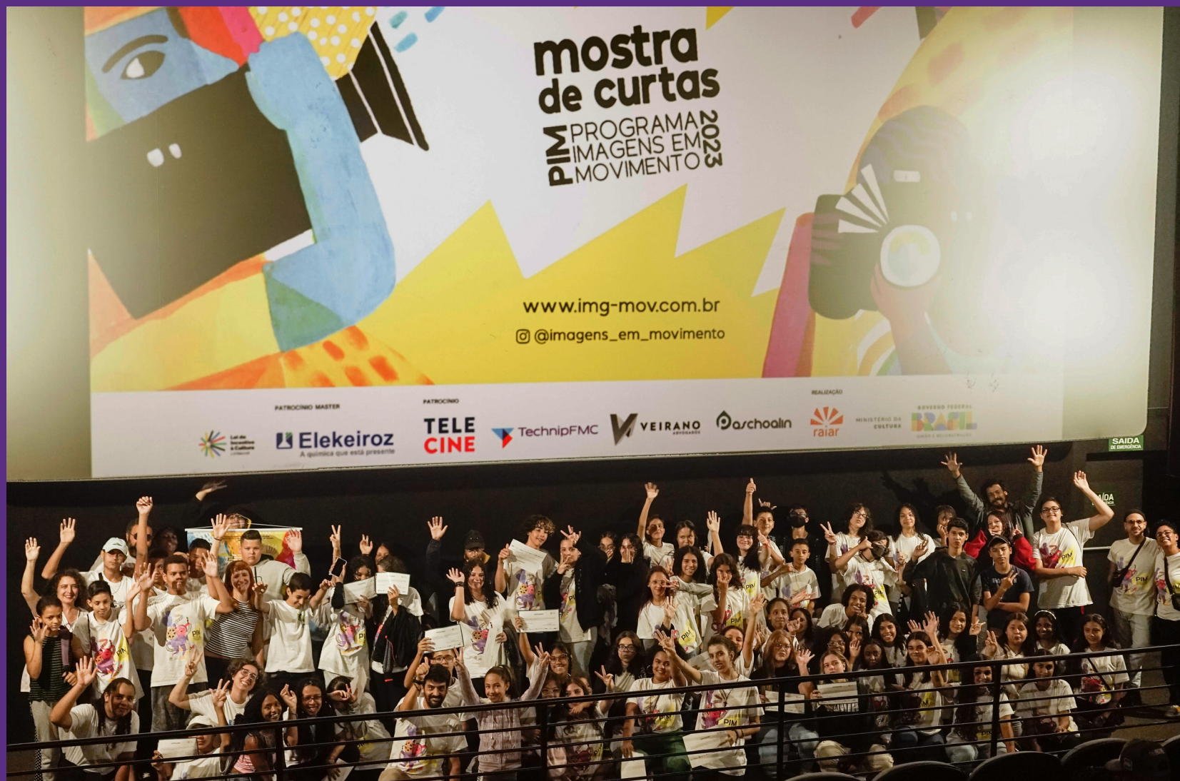
Sessões no Grupo Cine do Shopping Alegria