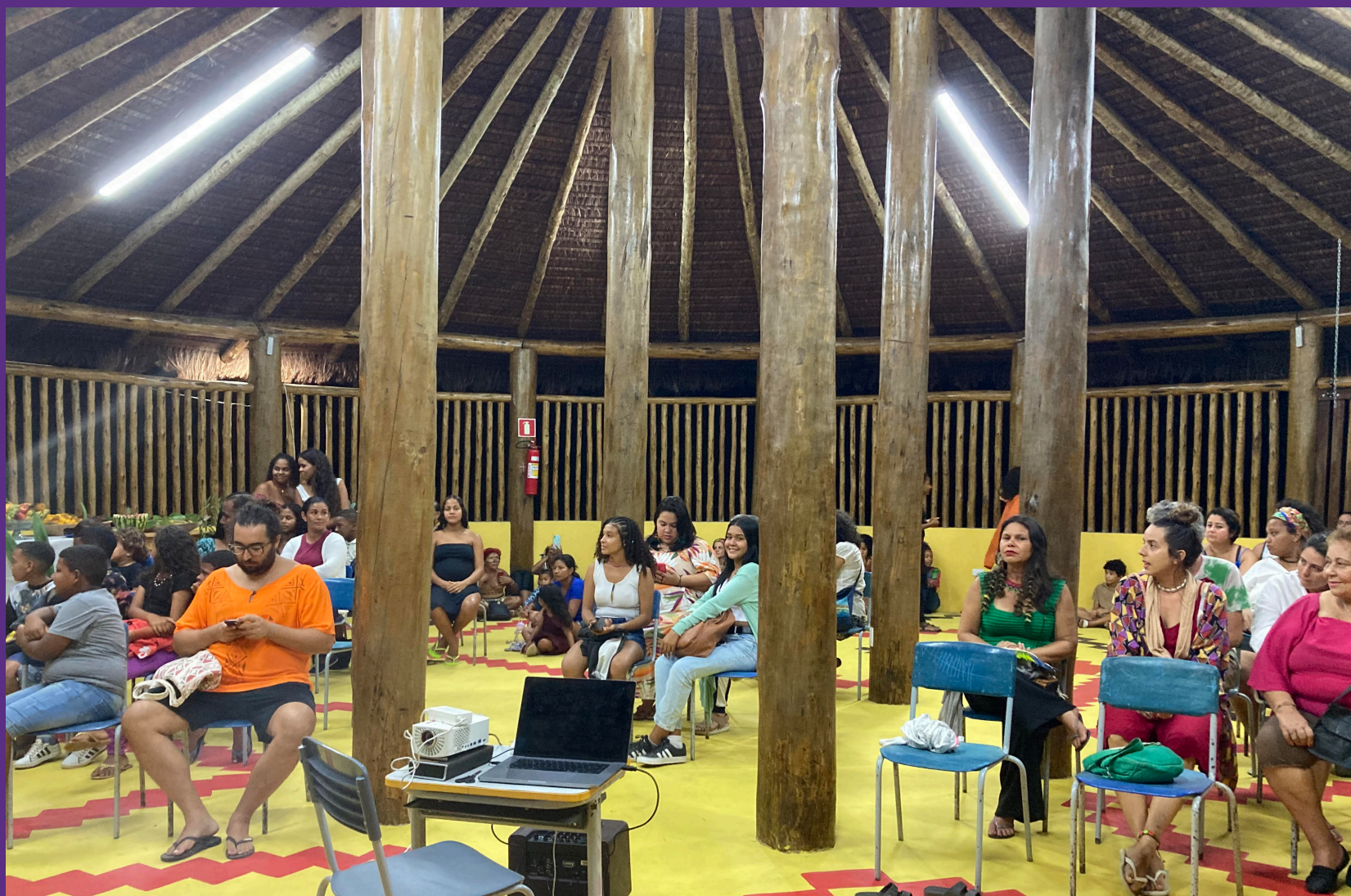
Kijeme da Aldeia Kai