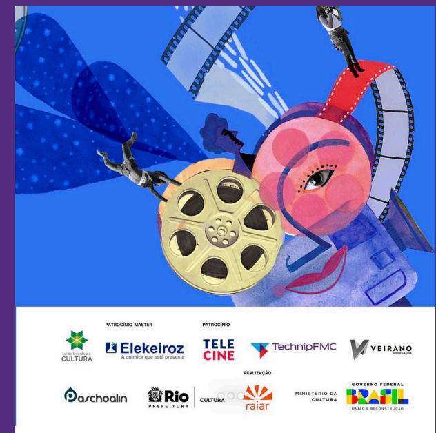
CARROSSEL // IMAGEM 3