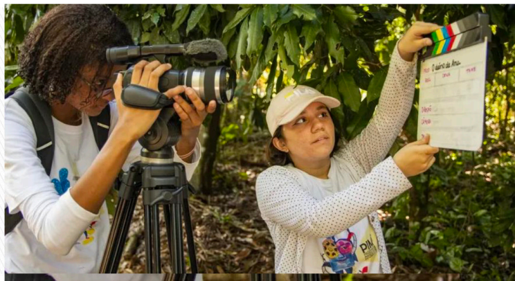
O Diário de Ana será exibido no Auditório do NUPEM/UFRJ