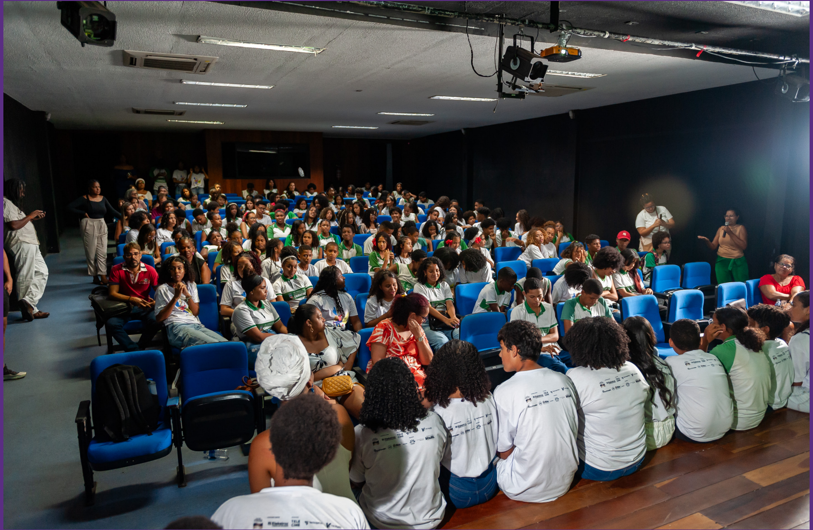
Teatro Alberto Martins