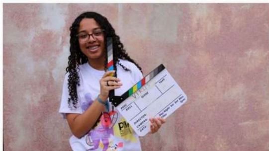
Estudantes da rede pública de Várzea Paulista participando de festival internacional de cinema na Alemanha

Publicado em 24 de maio de 2023 Por Redação Atualizado há 2 dias