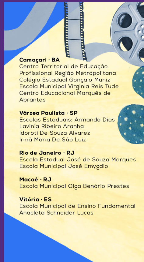
STORY // IMAGEM 2