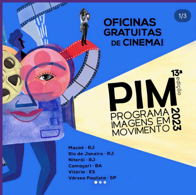
CARROSSEL // IMAGEM 1