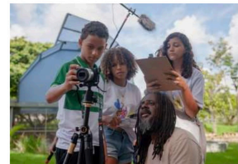
Alunos do projeto Imagens em Movimento