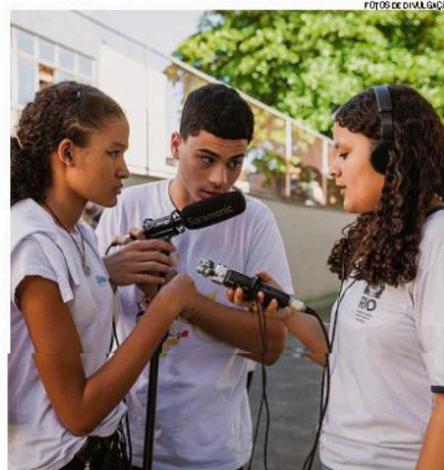
Começam a gravar. Estudantes do Calouste, autores de “O vento leva”

— Recomendamos apenas que os roteiros dos filmes falem de alguma forma de experiências de vida de nossos alunos, através da liberdade oferecida pela