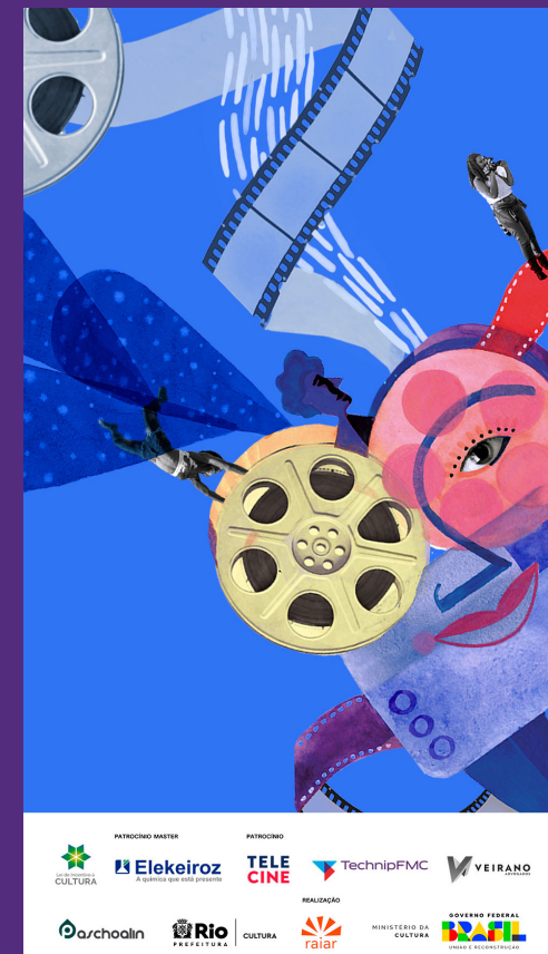
STORY // IMAGEM 3