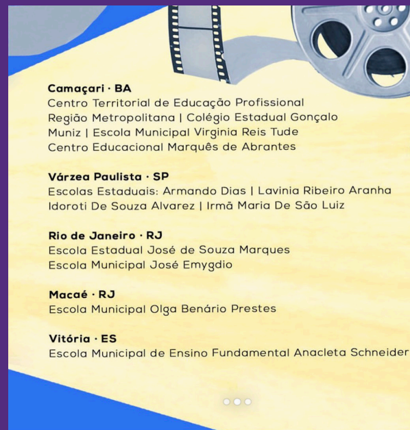
CARROSSEL // IMAGEM 2