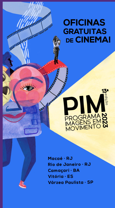
STORY // IMAGEM 1