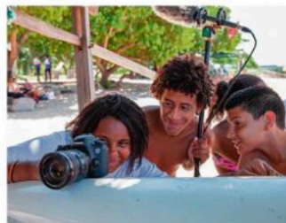
Teste no set. Alunos da Escola Municipal Brant Horta preparam filmagens de “O sonho”

ficção. O conjunto de curtas produzidos revela, assim, olhares da juventude contemporânea sobre situações que eles consideram importantes — diz.